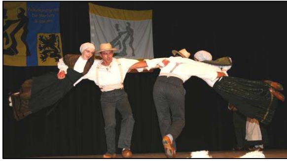
La Crouzade Volante